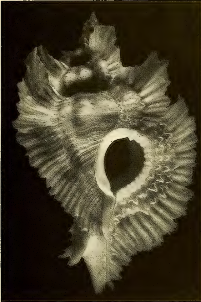
Abb. 3: Pterynotus miyokoae (69 mm) (rechts)

lippe ist sonst glatt, nur ein Juvenilstück (33,5 mm) weist am unteren Ende 2 Dentikel auf. Das Operculum ist gattungstypisch, mit endständigem Kern.